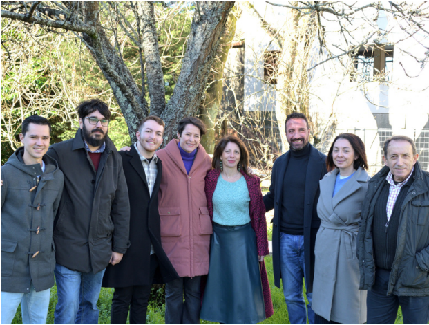
Candidatos á alcaldía na comarca de Muros Noia coa voceira nacional do BNG e coa nosa responsábel comarcal