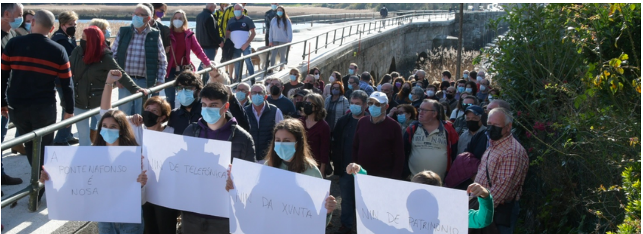
Concentración convocada polo BNG en defensa da Ponte Nafonso

Todo o noso traballo sempre ten un único obxectivo: mellorar a calidade de vida da nosa veciñanza. Para iso buscamos manter un contacto directo e constante, ben sexa a través de asembleas parroquiais, visitas ás distintas rúas e lugares do noso concello ou a través das redes sociais. Queremos escoitar a túa voz e saber das túas propostas para facermos un Outes mellor. Así é como entendemos que debe ser a política, por, para e coa xente. Se nos queres facer chegar algo non dubides falarnos a través das nosas redes sociais “bng de outes” ou no noso correo electrónico: outes@bng.gal