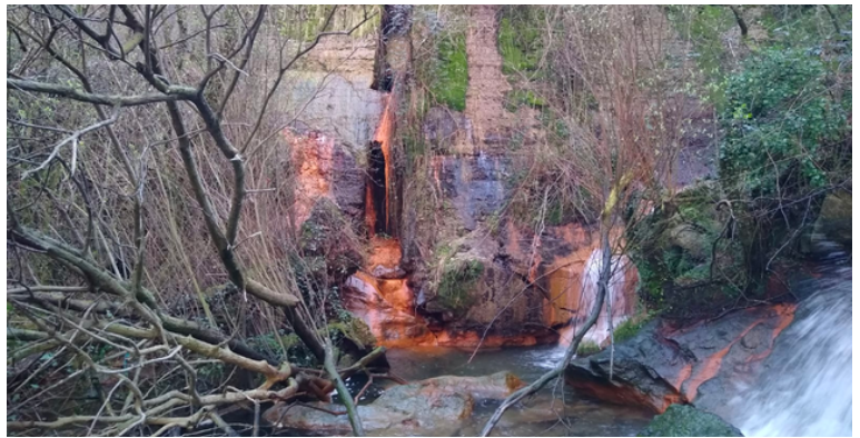
Presa de residuos mineiros de San Fins

Non contentos con isto, nos últimos anos Xunta e concesionaria estiveron dando pasos adiante na reactivación da mina de San Fins.