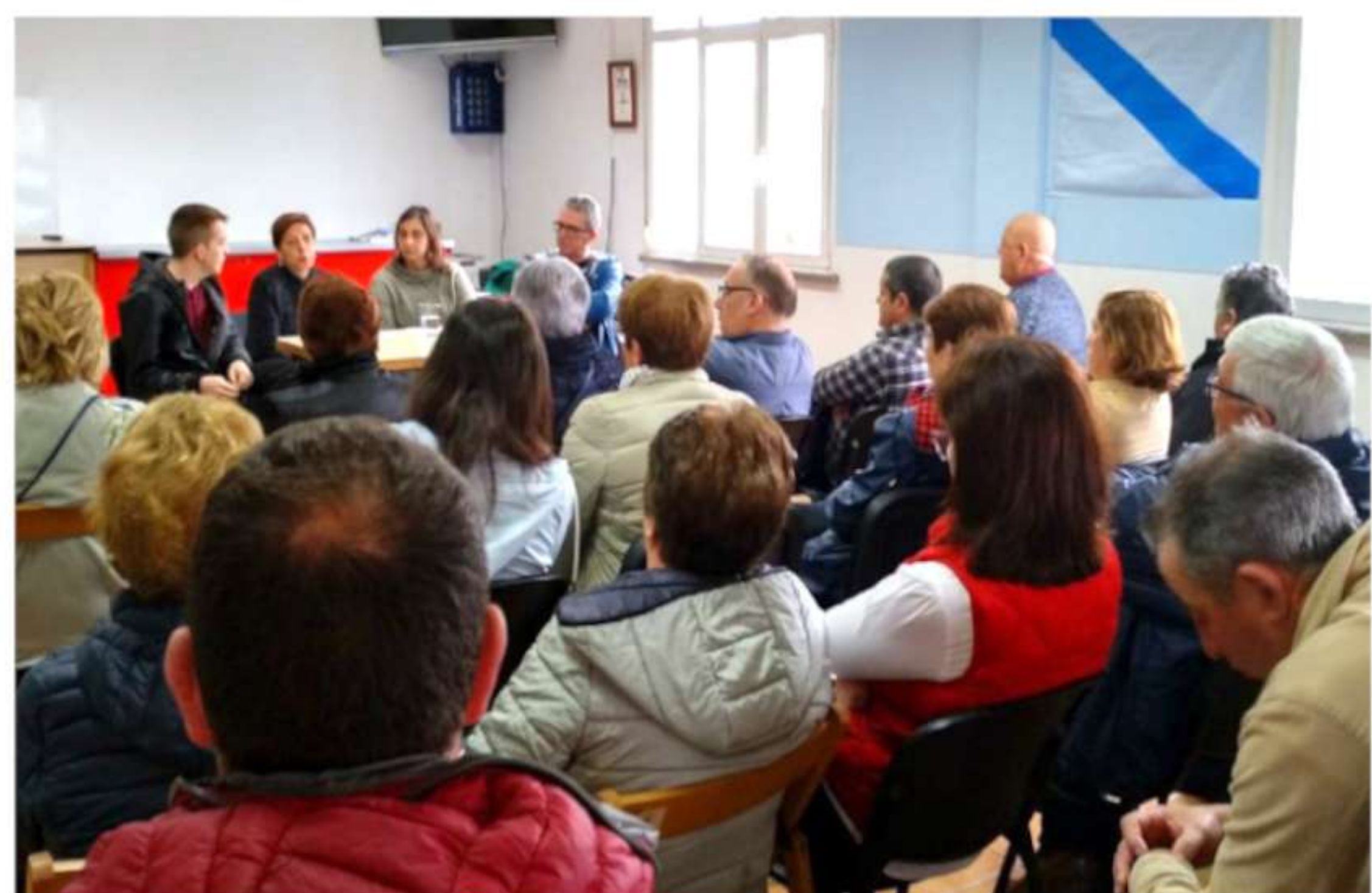
Visita parroquial no 2018

O 2020 ía ser unha continuación da nosa maneira de facer as cousas: con contacto directo e constante coa veciñanza, mais xusto cando íamos comezar coas visitas parroquiais comezou a catástrofe da pandemia.