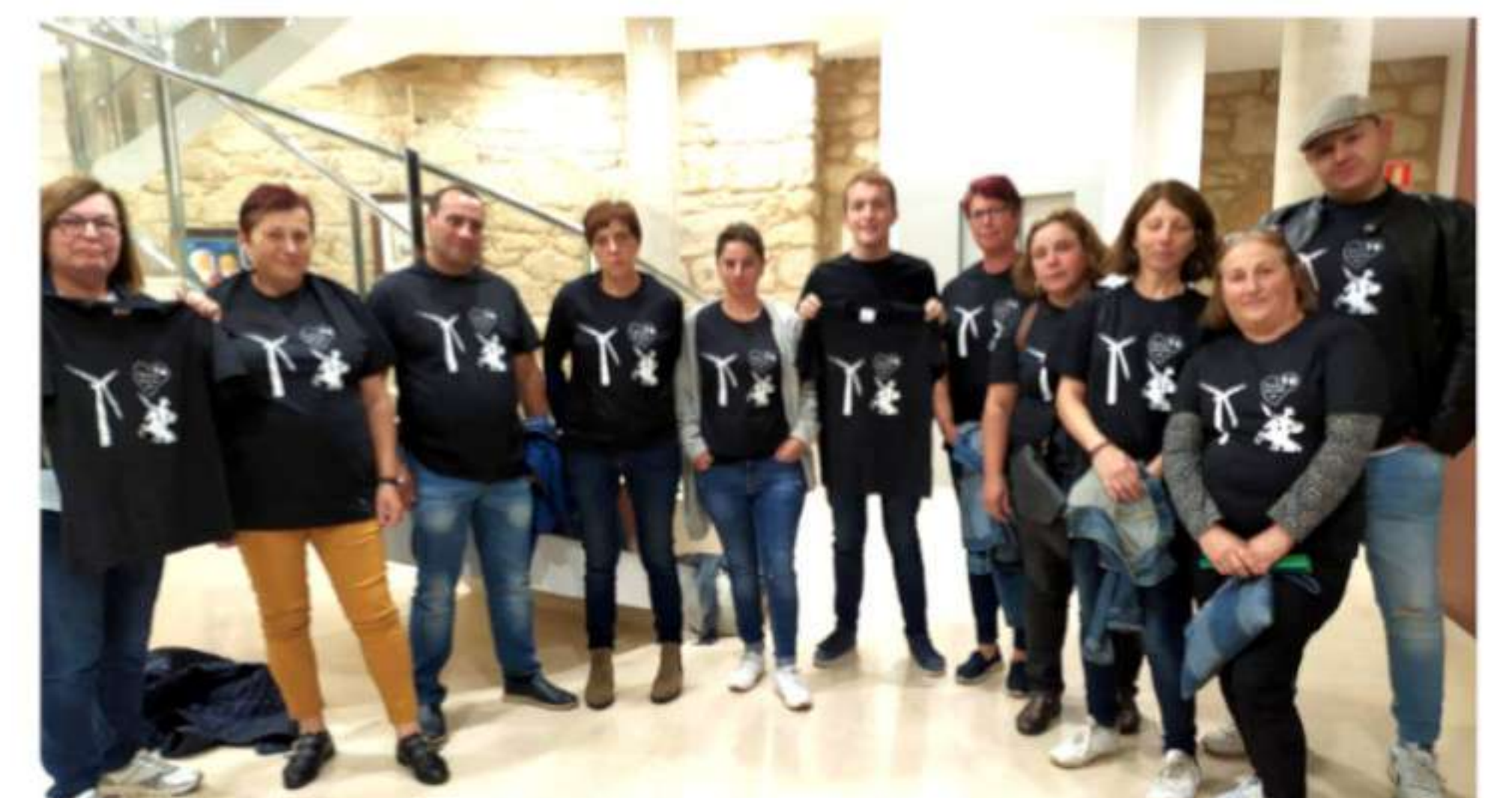
Plataformas veciñais na presentación da nosa moción en contra dos proxectos actuais no 2019

O goberno do señor González que presentou unhas alegacións aos parques que son unha auténtica chapuza, un corta/pega das alegacións presentadas polos veciños. Unhas alegacións nas que se chega a dicir que o parque de Banzas afectará aos usuarios de ADISBISMUR en troques do de Valadares.